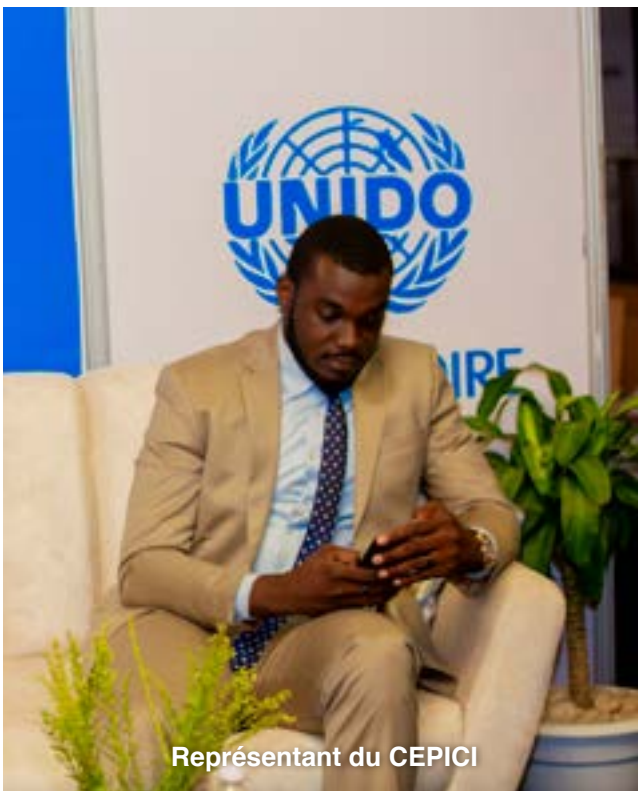
Représentant du CEPICI