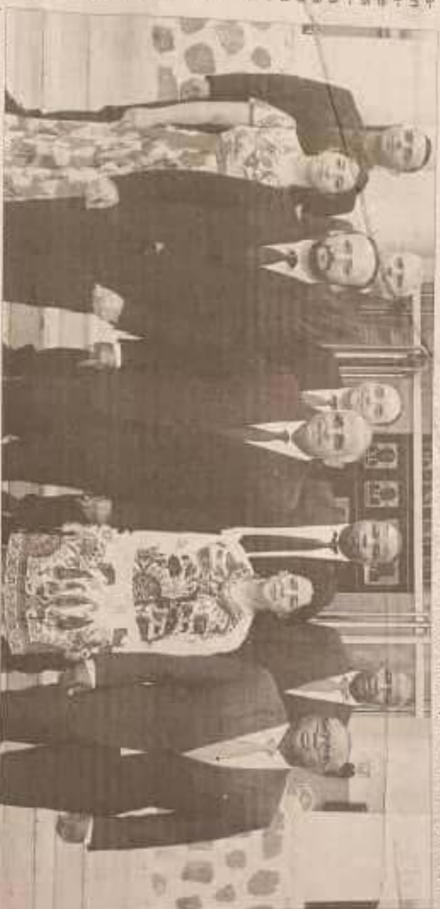
La rencontre entre le Premier ministre Patrick Achi et ses hôtes a porté sur la 6e édition du Sitic, organisée à Abidjan du 30 mai au 1er juin.

Le ministre tunisien des Technologies de la Communication, Nizar Ben Nejl, a été reçu, hier, en audience par le Premier ministre en marge du 6 e Salon International des Technologies de l'Information et de la communication, qui se tient à Abidjan du 30 mai au 1 er juin.