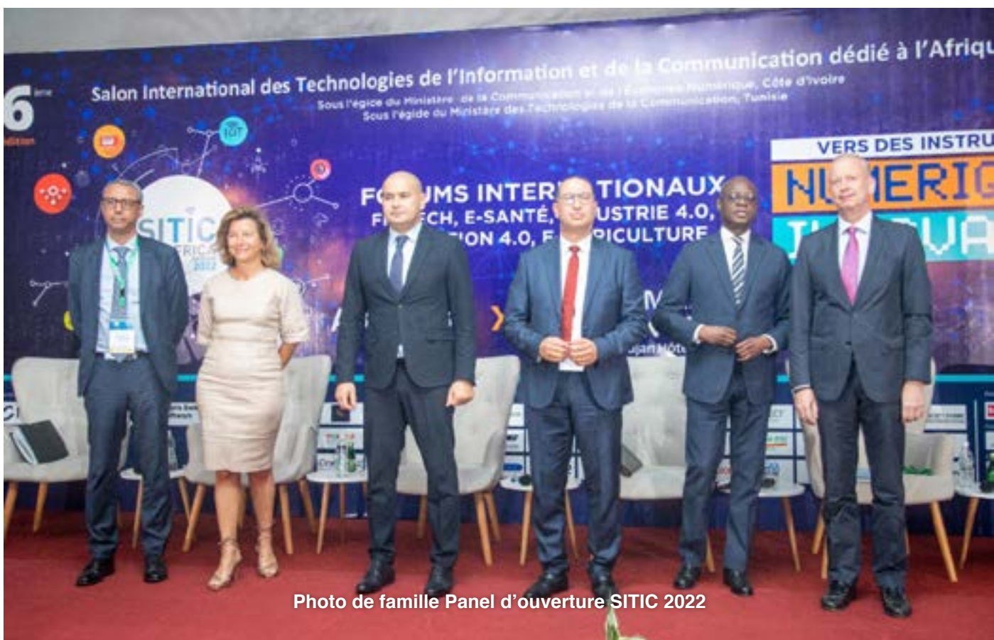
Photo de famille Panel d'ouverture SITIC 2022