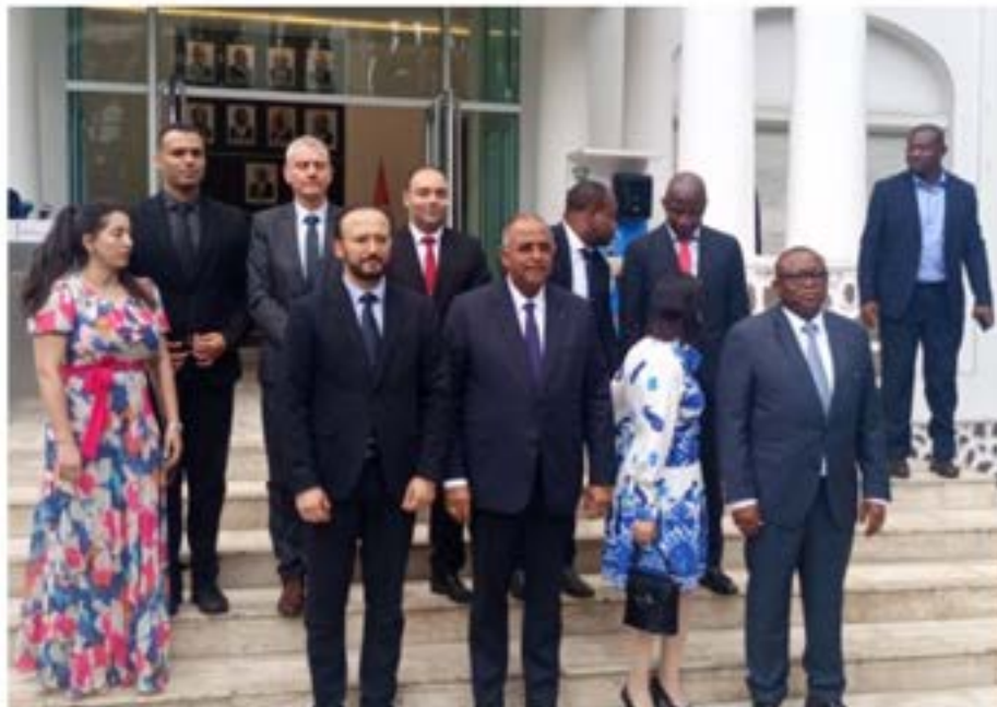
Le Premier ministre, Patrick Achi en compagnie de la délégation tunisienne