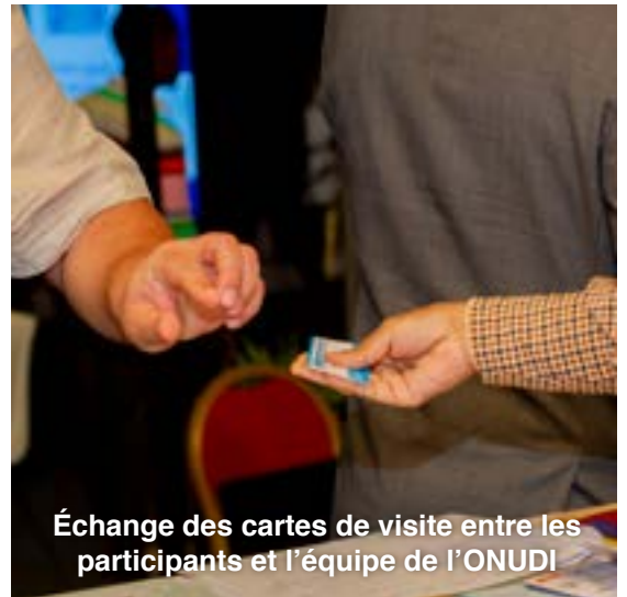
Échange des cartes de visite entre les participants et l'équipe de l'ONUDI