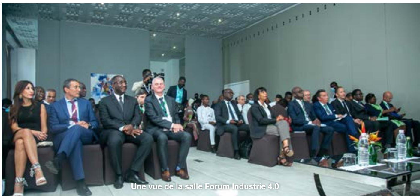
Une vue de la salle Forum Industrie 4.0