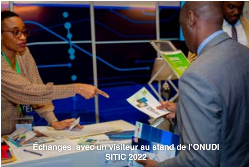
Échanges avec un visiteur au stand de l'ONUDI SITIC 2022