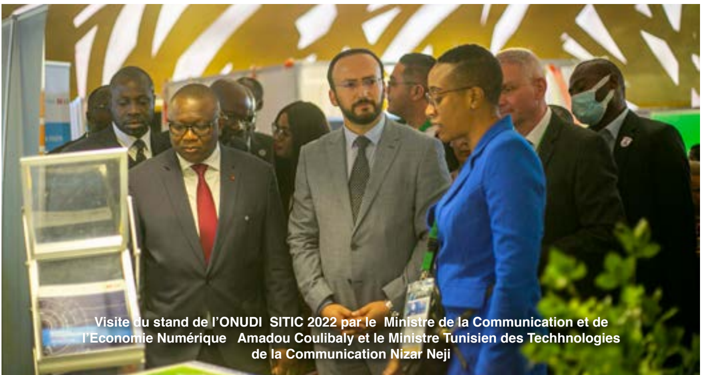
Visite du stand de l'ONUDI SITIC 2022 par le Ministre de la Communication et de l'Economie Numérique Amadou Coulibaly et le Ministre Tunisien des Technologies de la Communication Nizar Neji