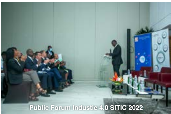
Public Forum Industrie 4.0 SITIC 2022