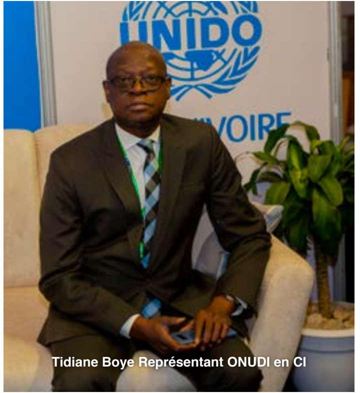
Tidiane Boye Représentant ONUDI en CI