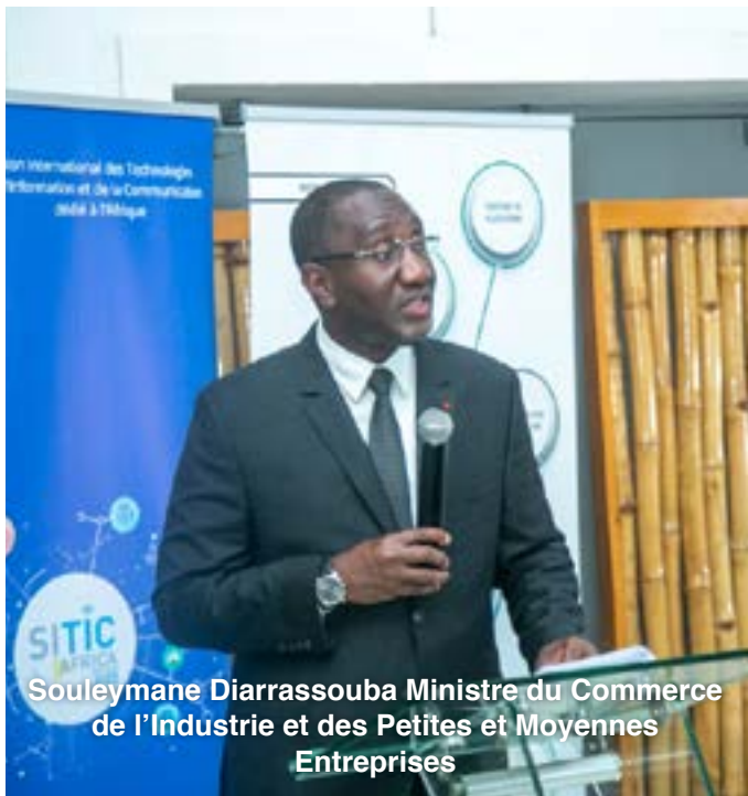
Souleymane Diarrassouba Ministre du Commerce de l'Industrie et des Petites et Moyennes Entreprises